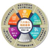
六大核心戰略產業