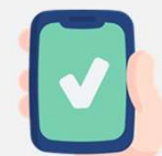
國外(歐盟)活化應用數