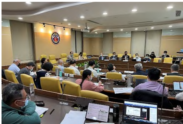
政府資料開放諮詢小組會議宣傳推廣