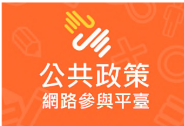
透過公共政策參與平臺募集建議