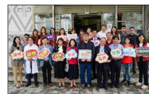
南投縣電信事業參與垂直應用服務場域參訪_智慧醫療03