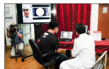
南投縣電信事業參與垂直應用服務場域參訪_智慧醫療02