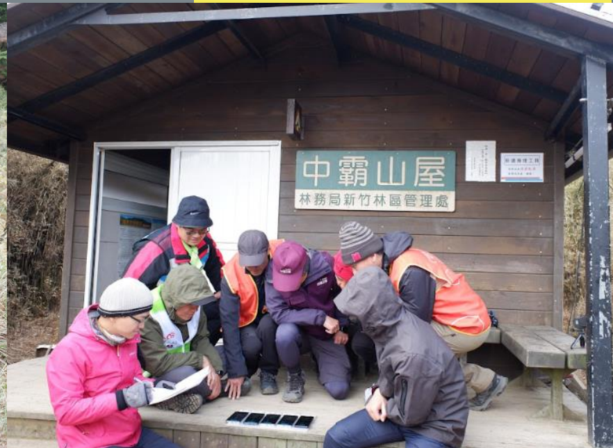
前往「九九山莊」及「中霸山屋」進行山林通訊量測，確保通訊品質改善成效