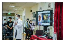
南投縣電信事業參與垂直應用服務場域參訪_智慧醫療01