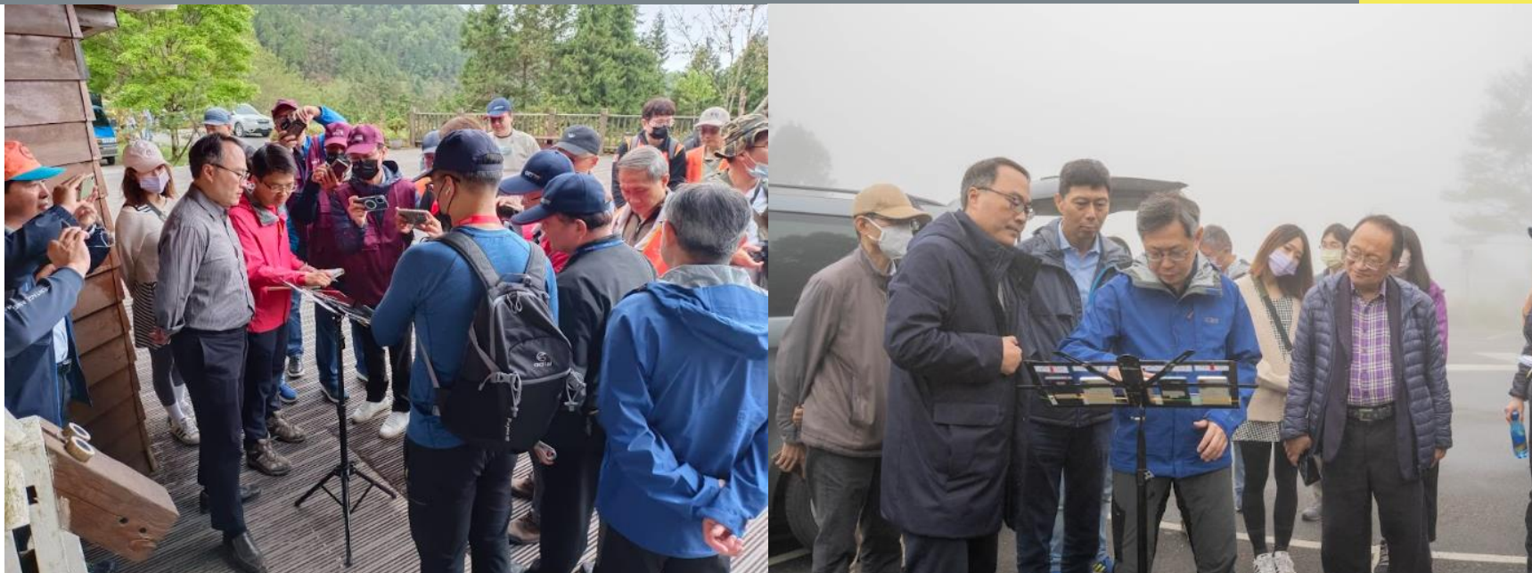
前往「翠峰山屋」進行山林通訊量測，確保通訊品質改善成效