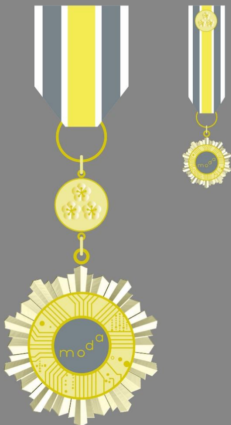
二等數位發展專業獎章 二等小型副章 三等數位發展專業獎章 三等小型副章