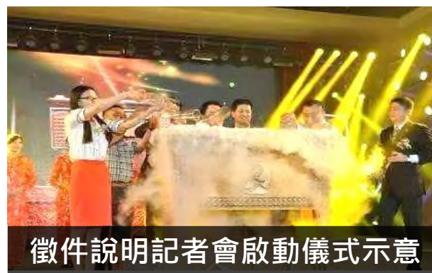
徵件說明記者會啟動儀式示意