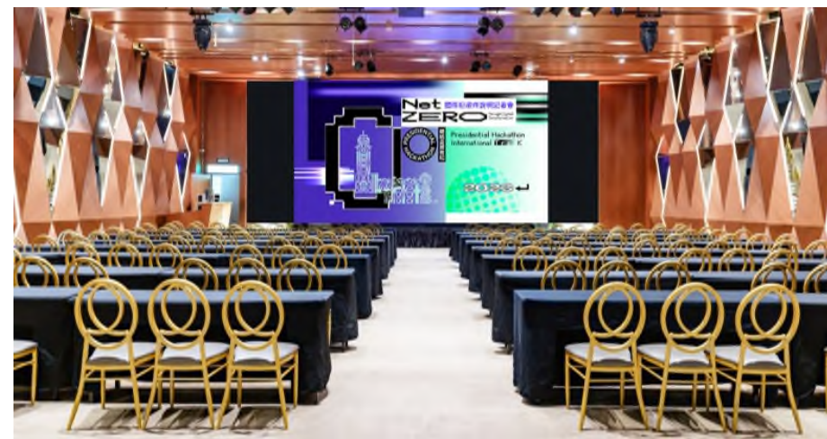
徵件說明記者會現場示意