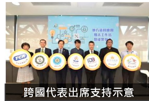
跨國代表出席支持示意